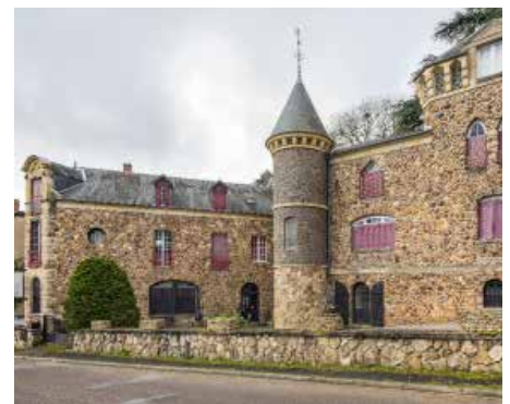
Crédit Photo : P-M. Barbe-Richaud. Service Inventaire et Patrimoine. Région Bourgogne-Franche-Comté. 2020.

> Renseignements et réservations au 03 86 30 43 10